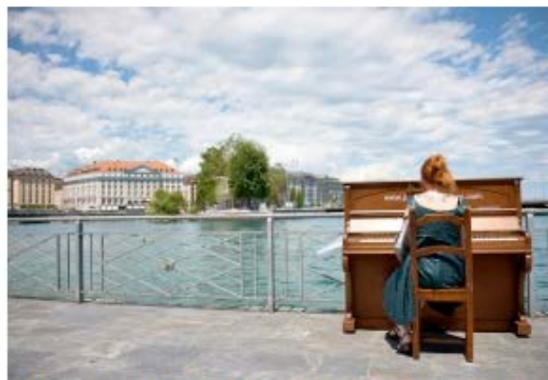
Cinquante-trois pianos pourront être utilisés, comme ici sur le pont de la Machine. Sébastien Puiatti

La septième saison de «Jouez, je suis à vous» démarre le 14 juin. Depuis que Genève s'est jointe à cette opération de pianos d'occasion en libre service, en 2011, celui-ci a rencontré un succès croissant. Cinquante-trois pianos pourront ainsi être utilisés à Baby Plage, place du Rhône, au parc des Bastions, au Jardin anglais où seront installés six pianos colorés, entre autres. La gare Cornavin et la rotonde de l'Hôpital auront droit à des pianos à queue.