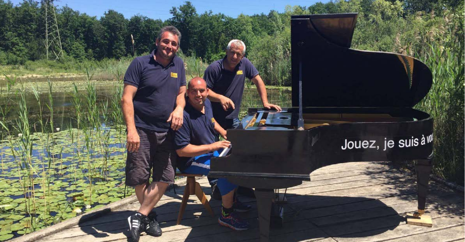
L'entreprise Blein au bord de l'étang des Mouilles