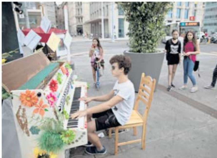
Le piano en libre accès de Bel-Air a déjà ses adeptes. G. CABRERA