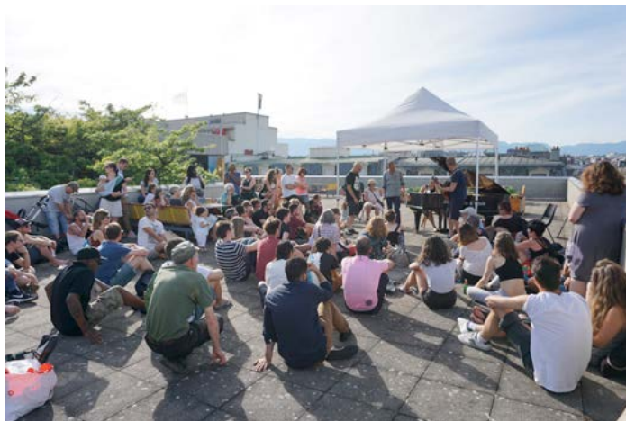
Hell's Kitchenette Cimetière des Rois – Genève